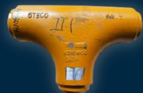
LONG SWEEP FULL FLOW TEE