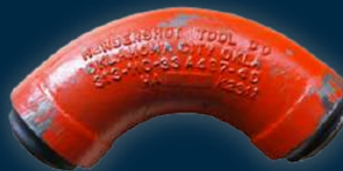
LONG SWEEP ELL 90°