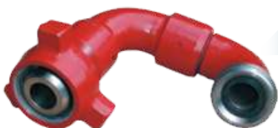
Fig. 1002 y 1502 Disponibles en 2" y 3" Diferentes estilos y configuraciones Conexiones MxF y MxM.