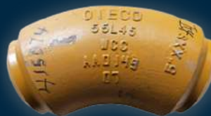
LONG SWEEP ELL 45°