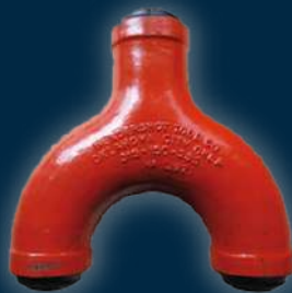
LONG SWEEP "Y"

Fabricados a partir de aceros de alto grado de calidad lo que permite una mejor soldadura para soportar altas presiones.