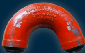
STANDPIPE GOOSENECK - 160°