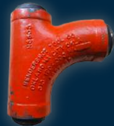
LONG SWEEP TEE